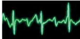
Signal filtré à l'aide de See-Thru CPR