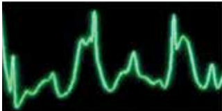
Signal de l'ECG non filtré durant la RCP

Le X Series incorpore également la technologie See-Thru CPR®, une technologie exclusive de ZOLL. La technologie See-Thru CPR filtre l'artéfact de compression afin de pouvoir afficher le rythme cardiaque sous-jacent du patient durant une RCP. En permettant au sauveteur de visualiser le rythme sous-jacent, cette technologie réduit la durée des pauses entre les compressions.